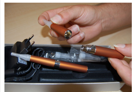
Elektronische Zigaretten (aufgeschraubt bzw. gebrauchsfertig) mit einsetzbaren Aromadepots (hinten) und Ladegerät